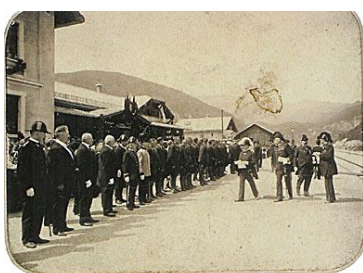
Princelomslednik Franc Ferdinand in drugi gostje na postaji Bohinjska Bistrica ob slovesni otvoritvi bohinjske proge 19. julija 1906.

V Bohinju je _____ prebivalcev, naravni prirastek pa je že več let _____. Povprečna starost moških je 38, žensk pa 43 let. Gostota prebivalstva je _____ prebivalcev na km 2 .