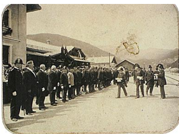
Priselnostednik Franc Ferdinand in drugi gostijo na postaji Bohinjska Bistrica ob slovesni otvoritvi bohinjske proge 19. julija 1906.

V Bohinju je _____ prebivalcev, naravni prirastek pa je že več let _____. Povprečna starost moških je 38, žensk pa 43 let. Gostota prebivalstva je _____ prebivalcev na km 2 .