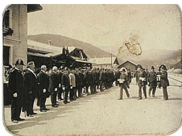
Prestolonaslednik Franc Ferdinand in drugi gostje na postaji Bohinjska Bistrica ob slovenski četvrti bohinjske proge 19. julija 1906.

V Bohinju je _____ prebivalcev, naravni prirastek pa je že več let _____. Povprečna starost moških je 38, žensk pa 43 let. Gostota prebivalstva je _____ prebivalcev na km 2 .